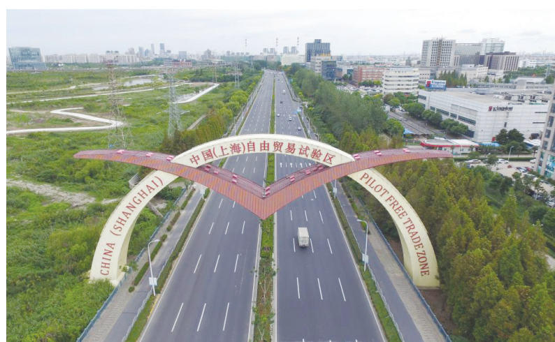
上海自貿區(資料照片)。

2013年9月29日，上海自貿試驗區掛牌成立，《中國(上海)自由貿易試驗區外商投資準入特別管理措施(負面清單)(2013年)》發布。這是中國第一次用負面清單管理外